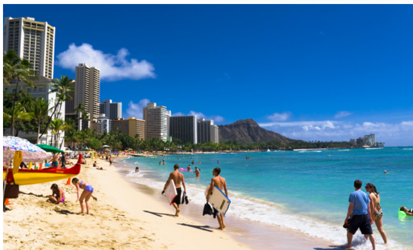
※画像はイメージです。

大手旅行会社の企画・実施する海外・国内ツアーがVIP会員なら最大10%OFFに。日本旅行をはじめ多数の旅行会社から幅広いツアーブランドを取り揃えています。