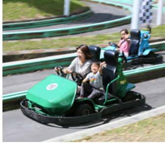
白樺リゾート池の平ファミリーランド

遊園地や水族館などお孫さんと楽しめる施設はもちろん、大人が楽しめる美術館なども 割引 に。