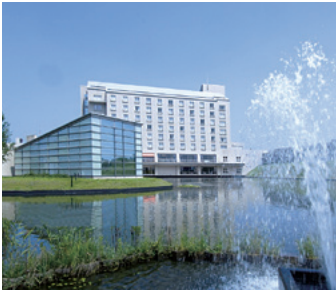
癒しのリゾート・加賀の幸 ホテルアローレ

約19,000軒の温泉宿やシティホテル、リゾートホテルを会員料金でご利用可能です。