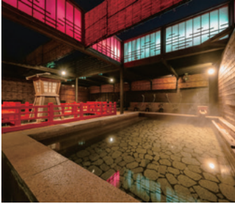
有馬温泉 太閤の湯

手軽な施設から一日寛げるテーマパーク型までお得にご利用いただけます。さらに 最大60%OFF の格安チケットもご用意しています。